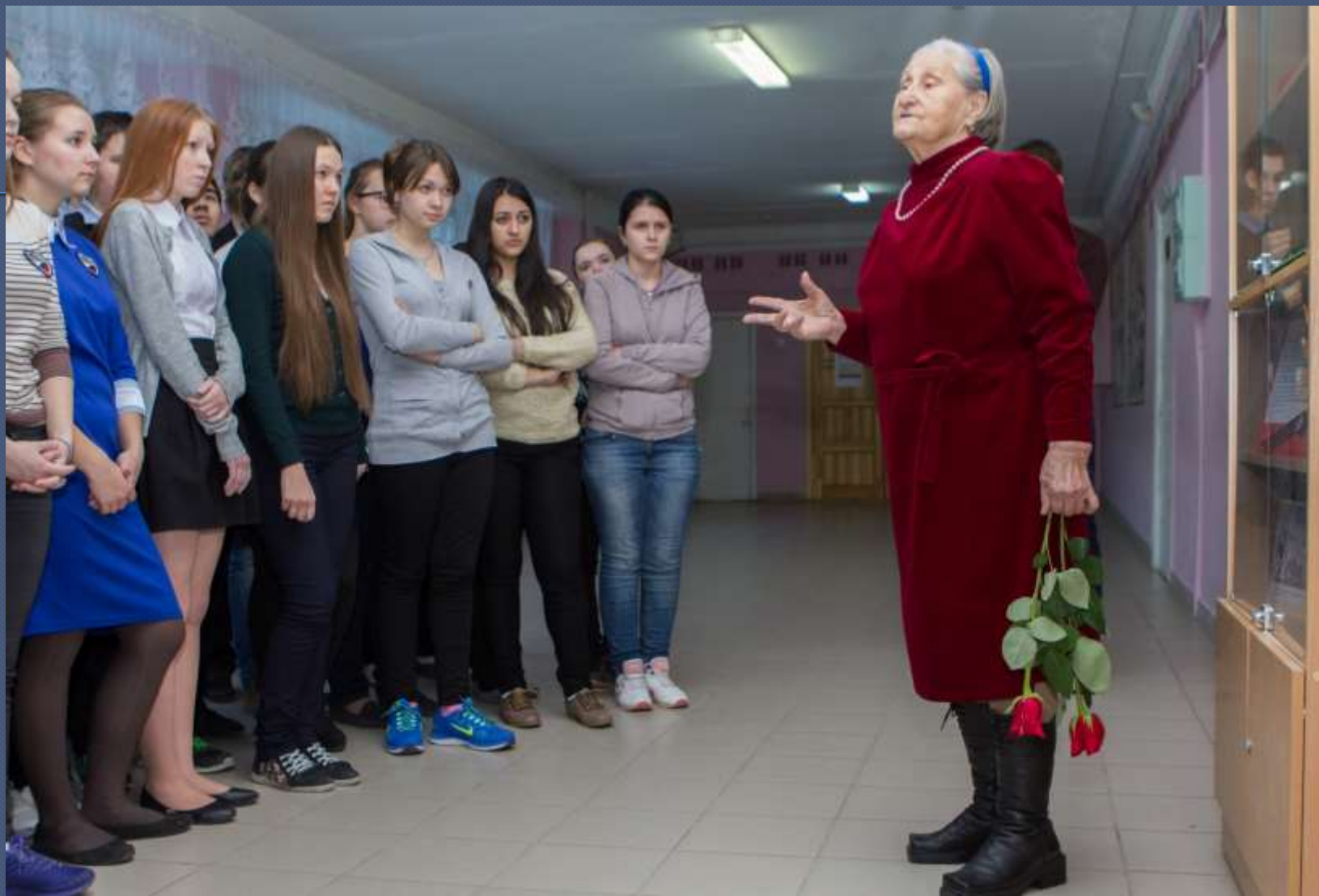
Встреча учащихся с сестрой героя. 2014 год.